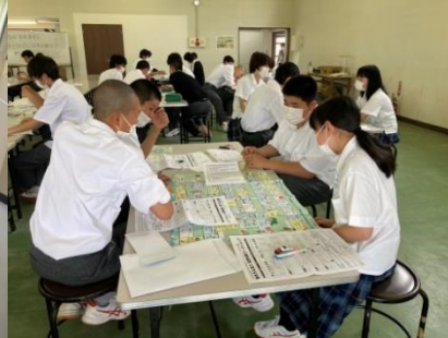
〈働き方&収入仮想体験ワーク〉