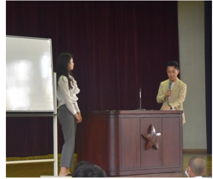
〈今日から君も話せるよ！〉

閉校式では、夢や希望へ一歩を踏み出そうとする意欲が、多くの生徒から感じられました。