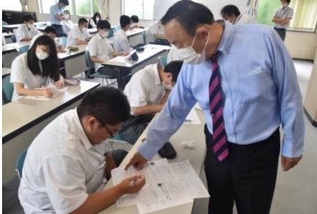
〈就職戦線の近況と対策〉